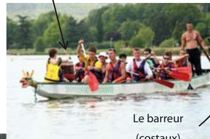
Le barreur (costaux)